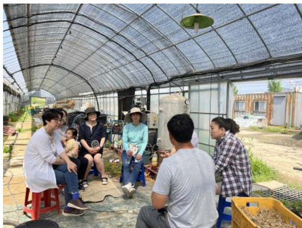
현장 워크숍 1회차(5/26)