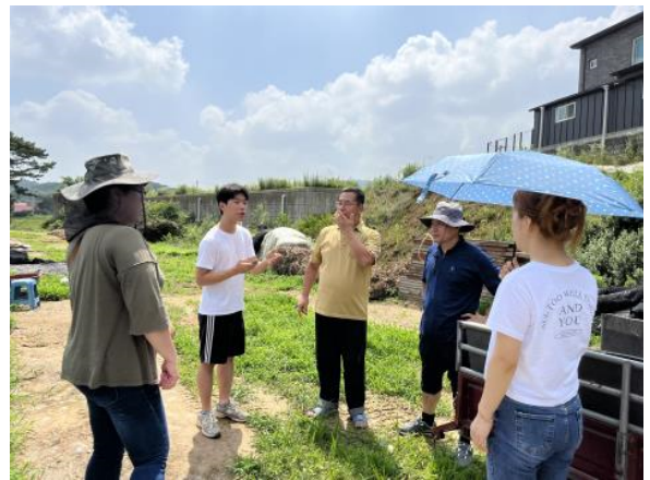
현장 워크숍 4회차(7/1)