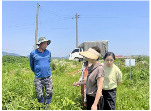
현장 워크숍 3회차(6/17)