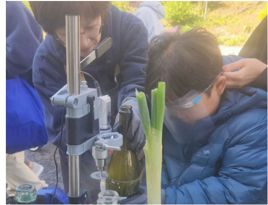
제로쿡 | 제로쓰레기