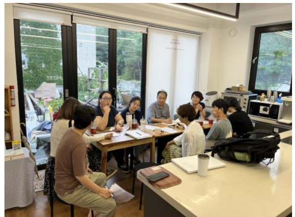
현장 워크숍 5회차(7/22)