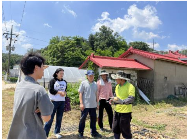
현장 워크숍 2회차(6/3)