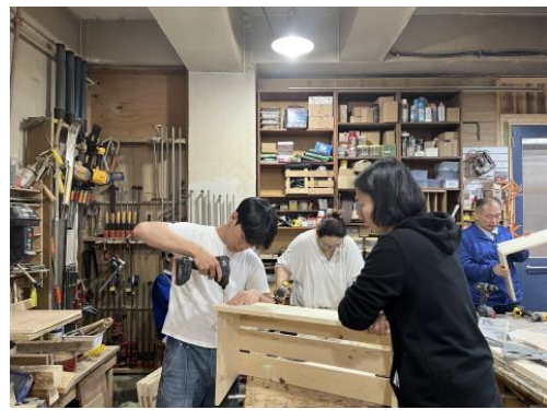
역량강화 워크숍 2회차(5/29)