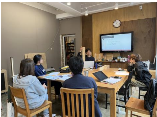
역량강화 워크숍 1회차(5/28)