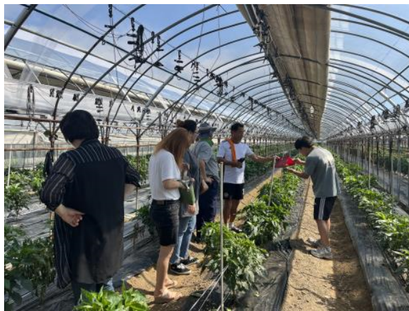
현장 워크숍 6회차(9/2)