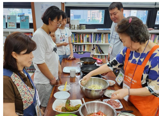
희망드리머 | 요리조리